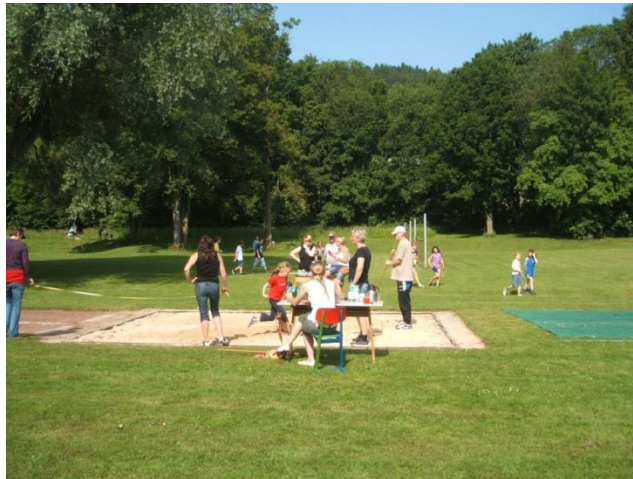
Eltern helfen bei den Bundesjugendspielen 2014