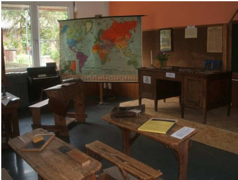
Blick in den Schulmuseumsraum

Ein besonderes Ziel ist die Leseförderung , die in einer ansprechenden Schülerbücherei und durch Unterstützung des „Vereins zur Förderung der Lesekultur im Einzugsgebiet der Gelstertalschule Hundelshausen e.V.“ in unterschiedlichen Aktionen und Projekten umgesetzt wird, z.B. durch die Lesewochen, die Büchertage, die Lesenächte oder Vor-lesetage durch Vorlesen mit eingeladenen Gästen des öffentlichen Lebens. Betreut wird die Schülerbücherei durch Eltern unserer Schule.