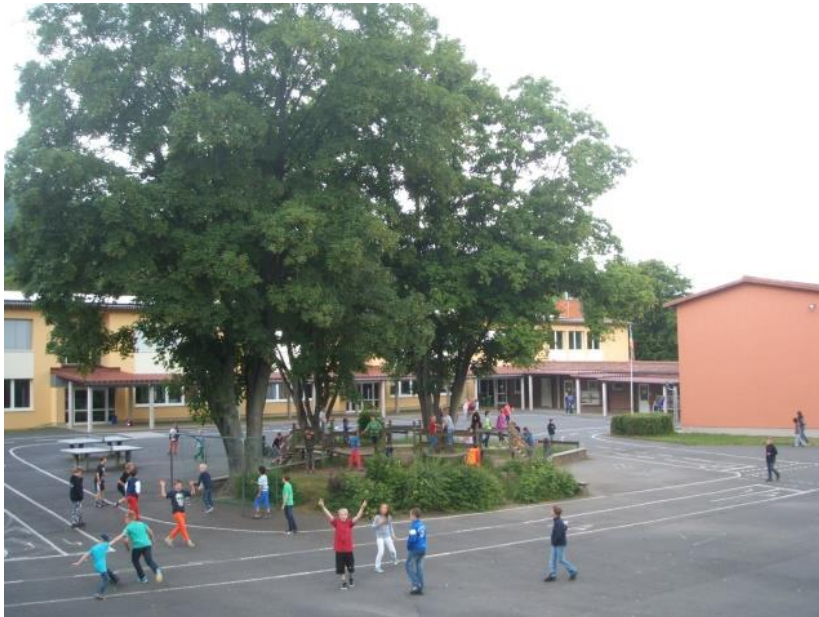
Blick vom Spielhügel auf den Schulhof

Die Gelstertalschule ist eine naturnahe Grundschule mit Vor- und Nachmittagsbetreuung, inklusiver Beschulung, Sprachheilunterricht und verschiedenen Angeboten zur individuellen Förderung und Entwicklung der Kinder aus 7 Stadtteilen der Stadt Witzzenhausen und 3 Stadtteilen der Stadt Großalmerode.