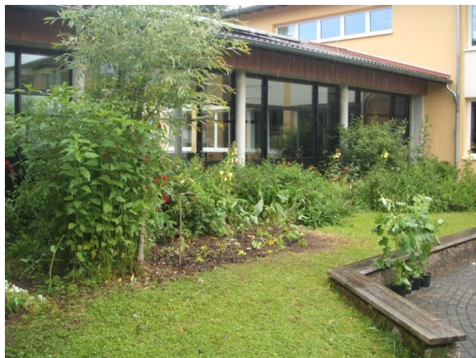
Blick in den Schulgarten

Die AOK Hessen fördert die Präventionsprojekte „Klasse 2000“ und „Schnecke“, die Aktion „Kinder für Nordhessen“ unterstützte 2014 ein Programm zur nachhaltigen Förderung von Konzentration und Arbeitshaltung der Schülerinnen und Schüler.