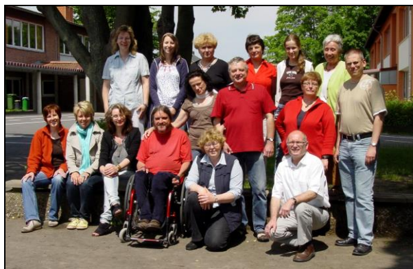
Die Lehrkräfte und die Sekretärin der Gelstertalschule 2011